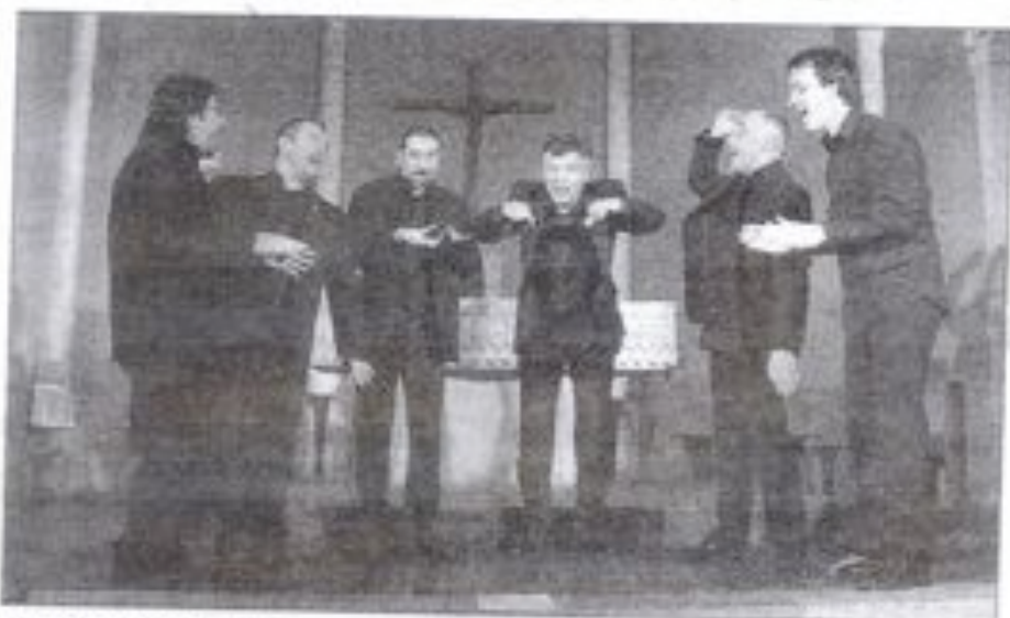
Vox Bigerri en concert.

Dans le cadre des Saisons de la Culture, Vox Bigerri donnait dernièrement un concert en l'église de Serres-Morlaàs. Vox Bigerri est un chœur d'hommes qui s'efforce de valoriser les polyphonies de tradition orale de l'Europe du Sud.