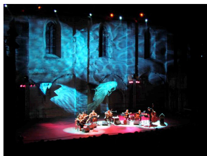
« Djangophonie », été 2005