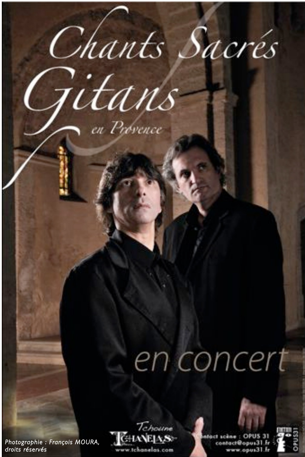
Ce spectacle est co-produit par Tchoune Tchanelas & OPUS 31